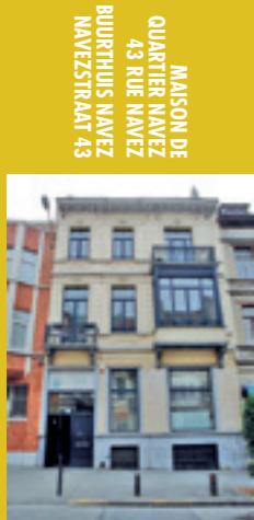
MAISON DE QUARTIER NAVEZ 43 RUE NAVEZ BURRTHUIS NAVEZ NAVEZSTRAAT 43