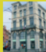
Contrat de quartier Navez-Portaels Wijkcontract Permanente Permanente

Contrat de quartier Navez-Portaels Wijkcontract Place Verboekhoven 9 Verboekhovenplein Angle Hoek Pr. Elisabeth Tel. 02 246 91 65 Fax. 02 216 27 73 www.renovas.be