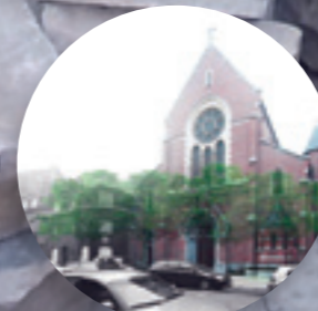
Aménagement de l'espace public • Cage-aux-Ours • Rue Portaels Inrichting van de openbare ruimte • Berenkuil • Portaelsstraat