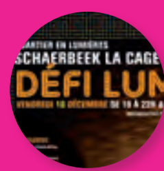
Quartier en Lumières Verlichten Wijk

Lettre d'information pour le quartier Nieuwsbrief voor de wijk Nje leter me informata per kete lagje Mahalle için bildiri mektubu رسالة إخبارية لحكيم Pismo informacyjne dla dzielnicy