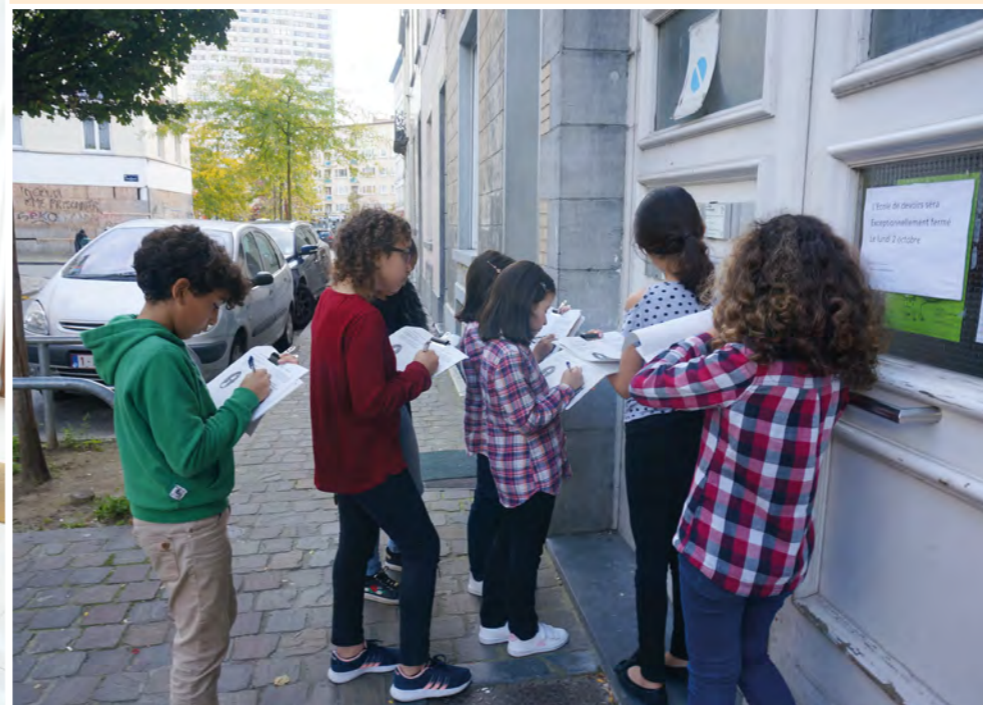
120 élèves des trois écoles primaires du quartier dessinent.