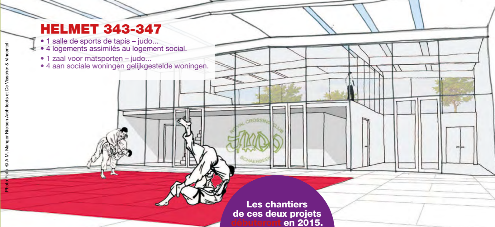
Photo Fot © A.M. Manger Nielsen Architects et De Visscher & Vincenelli

Les chantiers de ces deux projets débuteront en 2015. De werven voor deze twee projecten zullen aanvangen begin 2015.