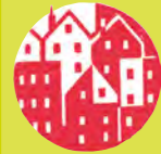
Imprimé sur papier recyclé avec encres végétales – Gedrukt op gerecycleerd papier met plantaardige inkt

Construction d'équipements et logements. Bouw van uitrustingen en woningen.