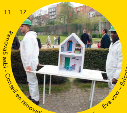
RenovaS asbl - Conseil en rénovation Renovatieadvies Eva vzw - Bricoteam